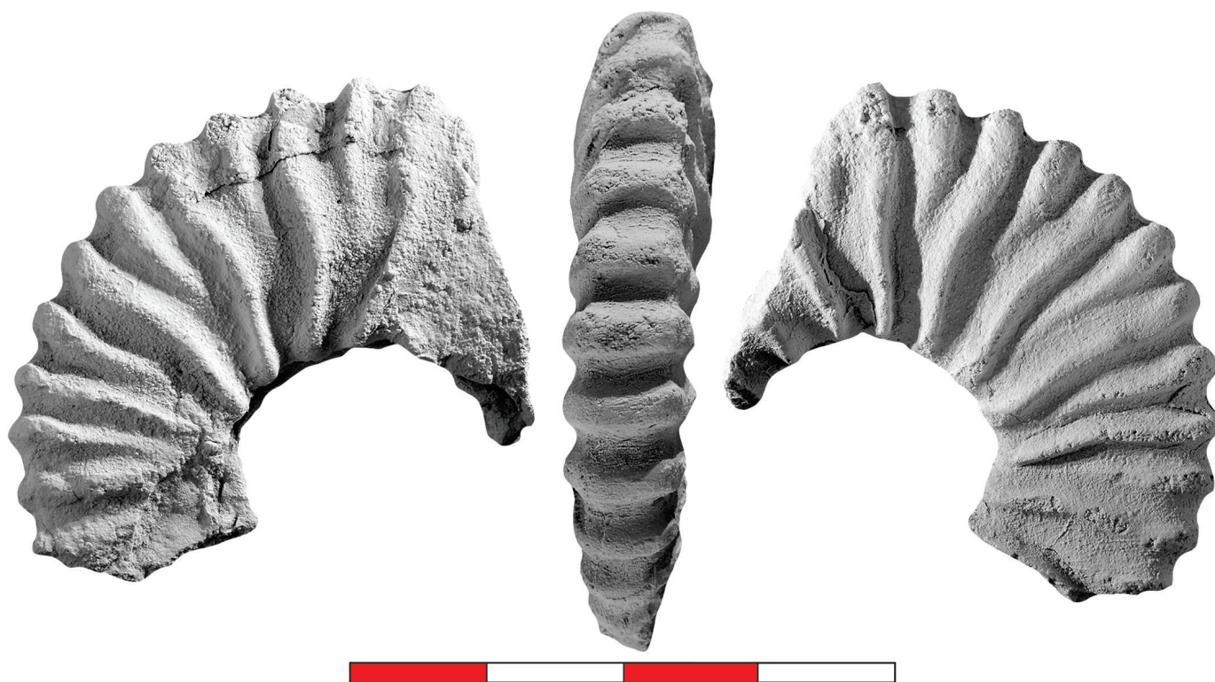
Figura 2. Juandurhamiceras sp., IGM 13090, cercanías de Campo Morado, Arcelia, estado de Guerrero. Escala gráfica 4 centímetros.