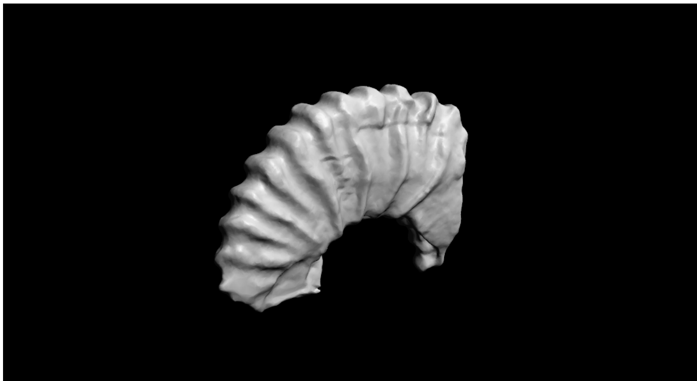
Figura 3. Modelo 3D digital de Juandurhamiceras sp., IGM 13090. El modelo 3D interactivo se puede activar haciendo clic izquierdo sobre la figura en la versión PDF de este artículo (requiere Acrobat Reader 9.0 o superior en todos los sistemas operativos).